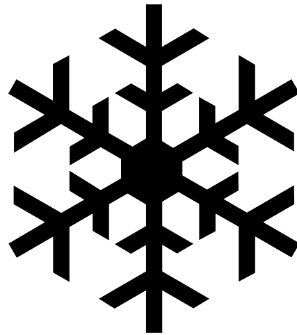
Gabarit à agrandir

Pour découper le polystyrène, je conseille l'utilisation d'un outil spécial qui chauffe, soit une scie spéciale à polystyrène, soit une gouge à adapter sur votre pyrograveur. En effet, le résultat avec un couteau laisse à désirer : état de surface irrégulier, formes courbes délicates à obtenir.