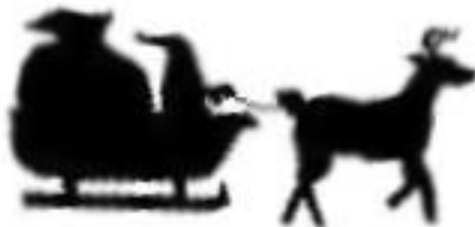
Silhouette en négatif à agrandir

Et pour les plus entreprenantes : réalisez des formes plus complexes telles un renne, et pourquoi pas le traîneau qui va avec ! A mettre au pied du sapin ou à suspendre à un mur.