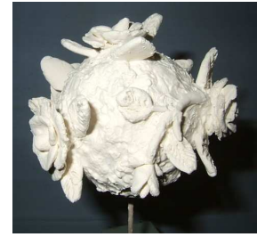
A R Tournadre

Voici une boule de Noël à suspendre ou à planter dans un centre de table tout à fait inédite. Pour celles qui aiment le 3D, au boulot ! Prévoyez deux heures de travail, sans interruption : la pâte extra light sèche très vite et le travail ne peut donc être interrompu.